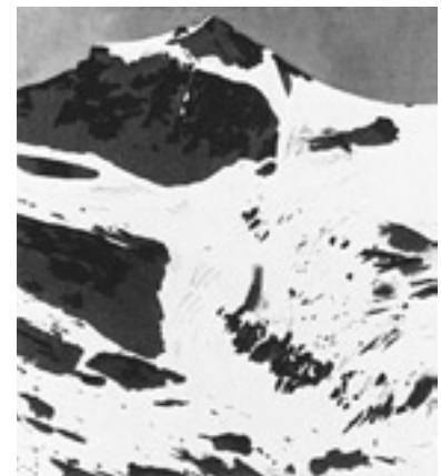
Gerhard Richter, Gebirge (WV Nr. 179-3), 1968, Amphibolin und Kohle auf Leinwand, 102 × 92 cm