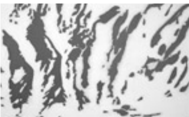
Fotografie Furka, Juni 2001, AL2001.016