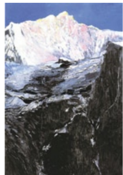
Herbert Brandl, o. T., 2001, Öl auf Leinwand, 195 × 130 cm, Privatsammlung, Courtesy Galerie Sabine Knust, München